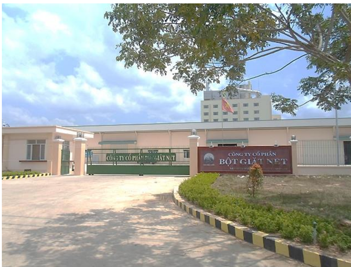
Trụ sở chính Công ty tại Đường D4, Khu công nghiệp Lộc An – Bình Sơn, xã Bình Sơn, huyện Long Thành, Đồng Nai