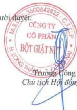
Trương Công Thắng Chủ tịch Hội đồng Quản trị