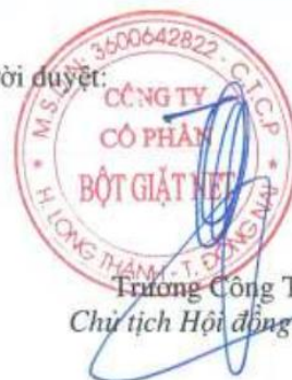
Trương Công Thắng Chủ tịch Hội đồng Quản trị