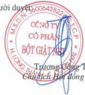
Trương Công Thắng Chủ tịch Hội đồng Quản trị