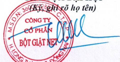
TRẦN QUỐC CƯỜNG